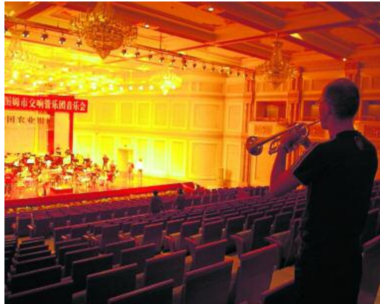
Einspielproben – wie hier in der Konzerthalle von Tjanjin – gehörten zum festen Bestandteil der 15-tägigen Tour.

chinesischen Gastgebern, dass die weit gereisten Gäste auch viele Eindrücke im Land des Lächelns sammeln konnten. Die Auftrittsorte lagen in Nord- und Südchina. So lernten die Musiker verschiedene Mentalitäten kennen. Während Europäer beispielsweise in Shanghai und Beijing nichts Ungewöhnliches sind, sorgten sie dagegen in den süd-